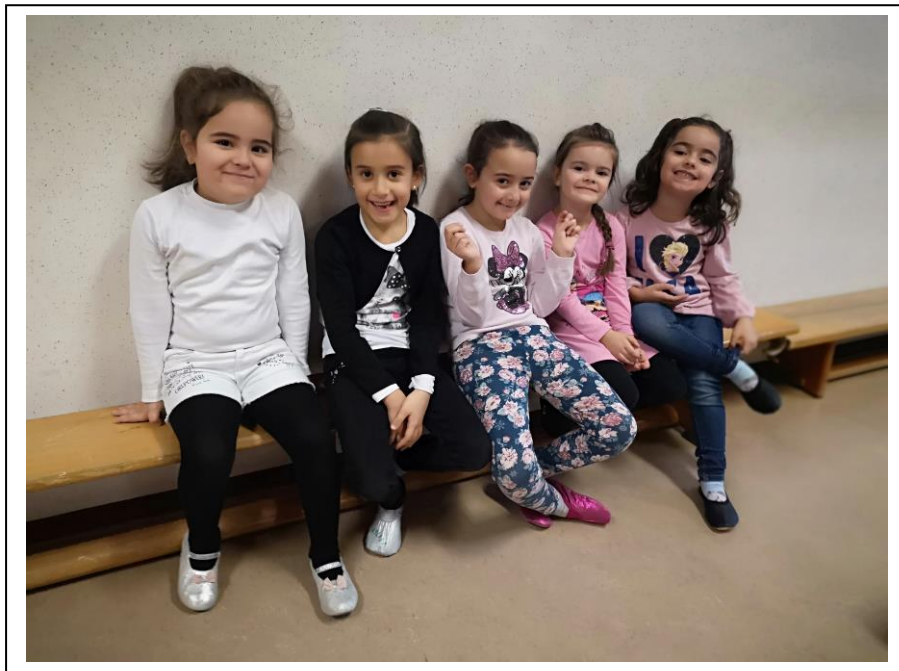
Kinder im Turnsaal

Wir leben eine Kultur, wertschätzend mit gesellschaftlicher Vielfalt umzugehen.