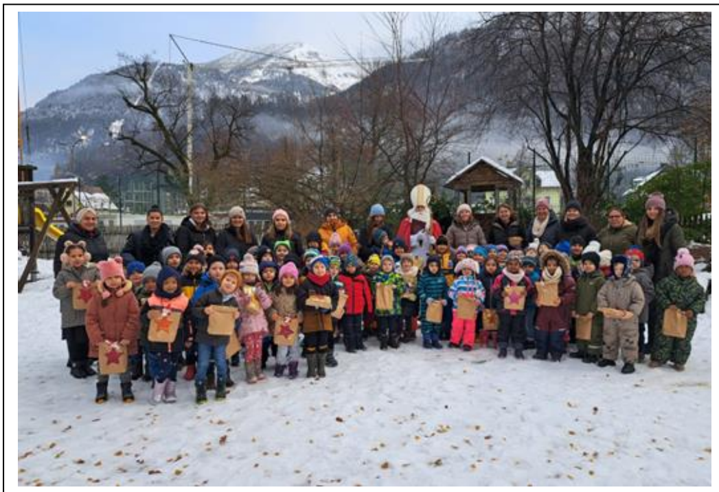
Besuch vom Nikolaus